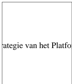
Strategie van het Platform

Vier keer per jaar zijn er netwerkbijeenkomsten voor netwerkleden waarin vakexpertise, bevindingen en vorderingen van projecten worden uitgewisseld. Voor de invulling van het programma van deze bijeenkomsten kunnen deelnemers zelf onderwerpen voorstellen. Afhankelijk van het onderwerp kan een gastspreker worden uitgenodigd of een project worden bekeken. Er wordt ruimte gegeven om elkaar te ontmoeten en om nieuwe contacten te leggen.