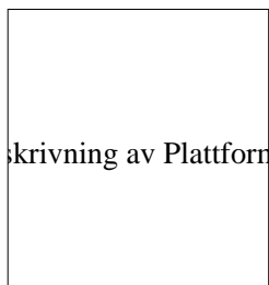
Beskrivning av Plattformen

POWER HOUSE EUROPE ingår i HSBs klimatsatsning. Det är en långsiktig kraftansträngning som syftar till att med moderna metoder och den senaste tekniken skapa ett klimat som vi alla kan bo och leva i. Bostadssektorns påverkan på klimatet är stor, knappt 40 % av energiförbrukningen i Sverige beräknas bostadssektorn stå för. Klimatfrågan är därmed en fråga som berör HSB i allra högsta grad, en fråga som HSB inte kan bortse ifrån.